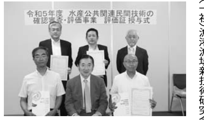
評価証授与後の集合写真

【一社】漁港漁場新技术研究会 術研究会は、8月2日に「ちよたつプラットフォーム」をテーマとした水産公共民間技術の確認審査・評価事業の評価証授与式を執り行った。水産公共民間技術の確認審査・評価事業は、依頼され