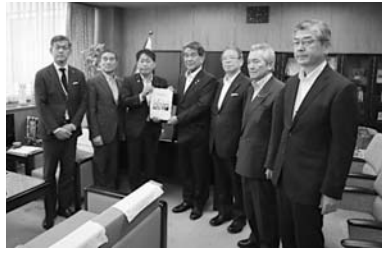
役員で武村展英農林水産副大臣へ要望書を手交

を7月19日に東京都内の商工会館で開催し、三団体を構成する全国水産都市三団体連絡協議会(議長、特定第三种漁港市長協議会(議長)、特定第三种漁港市長協議会(市長会))が、令和6年度事業計画(水産業を守り水産物の安定供給を図る政策に関する要望書)について審議し、全て原案とおり承認して、渡邊浩一整備課長が「漁場の保全・創造フェルカートホンの取