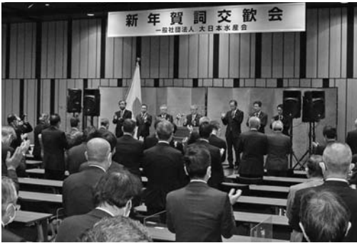
業界関係者が多数出席した

大日本水産会(白須敬明会長)は15日(木)、新年賀詞交歓会を東京・赤坂の赤坂イナシティA1Rで開催した。鈴木俊一財務大臣、浜田靖一防衛大臣らの水産関連議員や農水省・水産庁幹部、業界関係者が多数出席し、新年のスタートを切った。