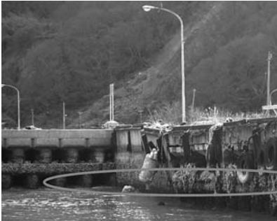
能登半島地震による地盤隆起の状況(石川県狼狽(のろし)漁港)

民間事業者の参入を促す。これまでの漁港は、海者による活用が中心であったが、今回の改正では法目的に「漁港の活用促進」を追加し、これまでの漁港整備を中心とした内容を整備エリアの活用を促す概念を追加。また、漁港施設等活用事業の推進等に関する事項を加えた。併せて、大きな柱となる「漁港施設等活用事業の創設・漁業上の制度」を創設。漁業上の