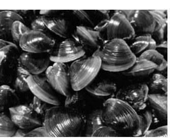
宍道湖のヤマトシジミ

島根が漁獲量全国一位を誇るシジミ。縄文時代の貝塚から貝殻が出ていることからも、太古より食料とされてきた。 俳句では、蛸(春)、土用蛸(夏)、寒蛸(冬)と三つの季節をカバ。宍道湖での産卵サイクルと重ねてみる。 産卵期は六月と重なり、最も身が太る旬は季語として、その前の春、土用は身の太りを保つギリギリの時期。産卵後の秋は身が痩せるが、寒くなると体力を回復して寒蛸。季語の設定とまあまあ合っている。