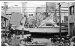
津波による背後地への流出

津波による背後地への流出 方向性については、すべり面が崩壊し、津波が背後地へ流出した。