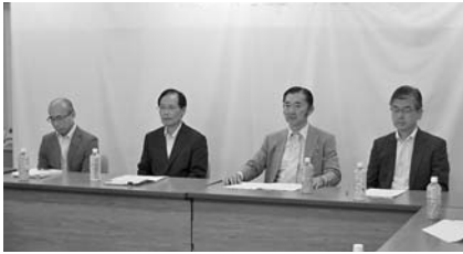
市町村支援連絡協議会関係団体の幹部

漁港漁場関係5団体 (公社)全国漁港漁場協会、(一財)漁港漁場漁村総合研究所、(一社)全日本漁港建設協会、(一社)漁港漁場新技術研究会、(一社)水産土木建設技術センターが結果