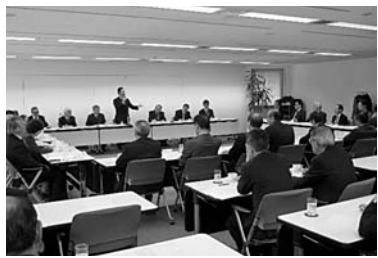
全国漁港漁場協会理事会の様子