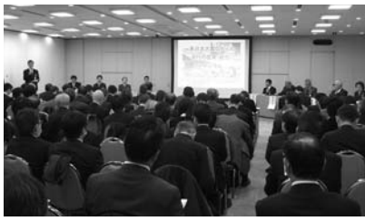
多くの関係者が参加した