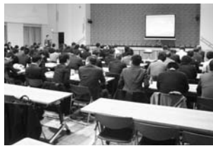
担当者会議の様子

一方、プレジャーボートの放置艇問題については、従来から対応はきているが、平成25年に国土交通省と水産庁とでプレジャーボートの