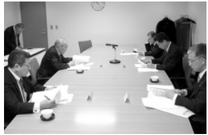
表彰候補者を選考した

（公社）全国漁港漁場協会の表彰委員会（委員長・伏見悦夫北海道漁港漁場協会）が、3月20日午前10時30分から千代田区電が関の商工会館で開かれ、各都道府県から推薦のあった平成26年度表彰候補者の選考を行った。その結果、功績者候補として漁港漁場協会役員1名、市町村職員11名を選考した。