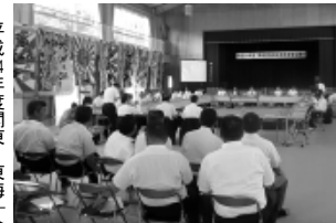
関東・東海地区漁港漁場協議会の様子

平成24年度関東・東海地区漁港漁場協議会が、7月10日（火）午後5時から、三重県鳥羽市答志島の「鳥羽市三三三ティアラナ」において、茨城、千葉、東京、神奈川、静岡、愛知、三重の と高付加価値化を支える漁港の生産・流通機能の高度化と老朽化対策の推進 1、水産資源の生産力の向上と豊かな生態系を維持するための水産環境整備の推進