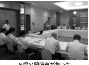
9県の関係者が集った