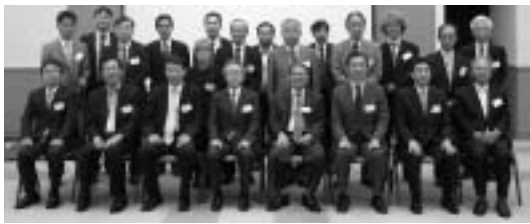
交流会議の参加者

第15回日韓漁港漁場技術交流会議が、6月20日(日)全国漁港漁場協会の主催で、(社)全国漁港漁場協会 田中 潤児 東京(5114)9981 定価 1部 70円 (会員の購読料は会費の中に含む) 第15回日韓漁港漁場技術交流会議が、6月20日(日)全国漁港漁場協会の主催で、(社)全国漁港漁場協会 田中 潤児 東京(5114)9981 定価 1部 70円 (会員の購読料は会費の中に含む)