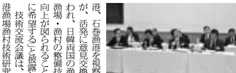
活発な意見交換が行なわれた

第15回日韓漁港漁場技術交流会議が、6月20日(日)全国漁港漁場協会の主催で、(社)全国漁港漁場協会 田中 潤児 東京(5114)9981 定価 1部 70円 (会員の購読料は会費の中に含む) 第15回日韓漁港漁場技術交流会議が、6月20日(日)全国漁港漁場協会の主催で、(社)全国漁港漁場協会 田中 潤児 東京(5114)9981 定価 1部 70円 (会員の購読料は会費の中に含む)