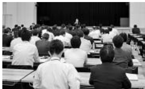
担当者会議の様子