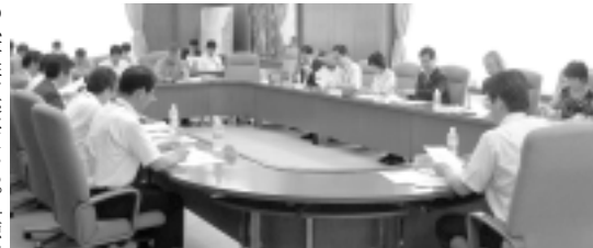
漁村活性化のあり方検討会の様子

漁村活性化のあり方検討会では、①地域資源を活かした魅力的で個性的な漁村づくり、②漁業の振興と提言。「働きたくなる漁村づくり」に関しては、①漁業の振興、②低・未利用資源の活用による漁村づくり、③漁港整備部防災漁村課が「漁村活性化のあり方検討委員会」を組織し、漁村活性化のあり方について、「中間取りまとめ」案を説明し、各委員が意見を述べた。水産庁では、意見を反映した「中間取りまとめ」を作成し、それに基づき漁業の向上、維持の必要性の国の水産関係政策要求に活用していく考えで、中間取りまとめ案で、