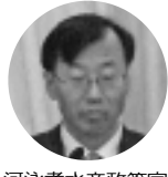
河泳孝水産政策官

現在、両国の水産業、漁村は漁業環境や資源状況の悪化による漁業生産の減少、漁業者の減少・高齢化など深刻な問題を抱え、漁村地域の活力低下が懸念されている。これらの問題を打破し、漁