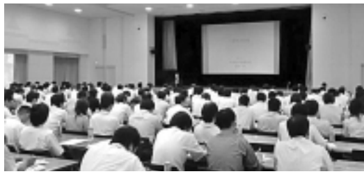
漁港漁場管理者研修会の様子