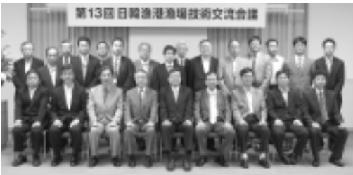
参加者の記念撮影

平成22年7月15日 発行 毎月1回15日発行 編集兼社団法人 全国漁港漁場協会 田中 潤児 東京都港区赤坂1-9-13三会堂ビル8階 電話 東京(5114)9981 定価 1部 70円 (会員の購読料は会費の中に含む)