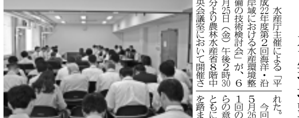
第2回水産環境整備技術検討会 水産庁主催による。平成22年度第2回海洋・沿岸域における水産環境整備の技術検討会が、6月25日（金）午後5時30分より農林水産省8階中央会議室において開催された。

水産庁主催による。平成22年度第2回海洋・沿岸域における水産環境整備の技術検討会が、6月25日（金）午後5時30分より農林水産省8階中央会議室において開催された。