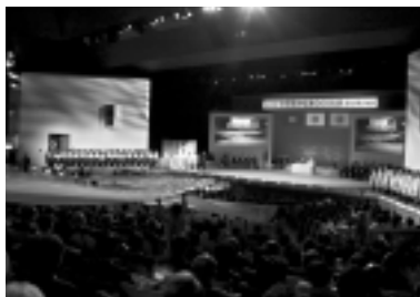
式典の様子 1日に岐阜市の岐阜クラウドホテルでレセプションが行われ、13日には開閉式典が、岐阜県庁本庁舎で式典が行われた。

「第30回全国豊かな海づくり大会」が、岐阜市で開催された。大会は、「清流が未来の海づくり」をテーマに、初の河川を舞台に開催。森川・海のつなぐが6月12・13日、天皇皇后両陛下をお迎え、水と地球環境を守ると、岐阜県の岐阜市と関