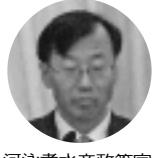
河泳孝水産政策官