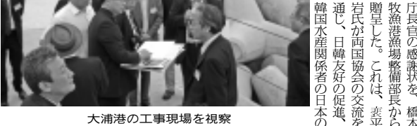
大浦港の工事現場を視察