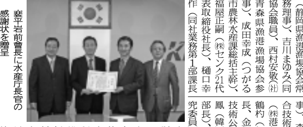
釜山市長に水産庁長官の感謝状を贈呈

交流会議は、平成9年に第1回を東京で開催して以来、毎年日韓間で相互に開催、漁港漁場関係者の交流の場として、韓国漁村漁協のインフラ整備、維持管理、技術等に関する問題について発交換している。