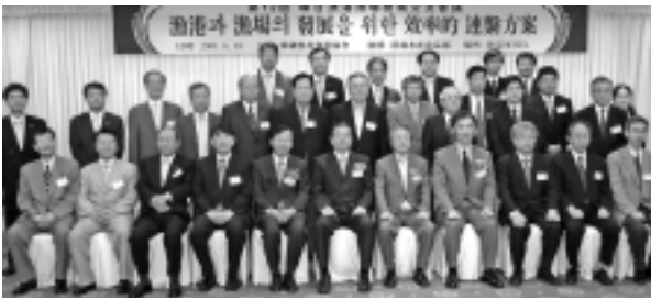
技術交流会議の参加者

交流会議は、平成9年に第1回を東京で開催して以来、毎年日韓間で相互に開催、漁港漁場関係者の交流の場として、韓国漁村漁協のインフラ整備、維持管理、技術等に関する問題について発交換している。